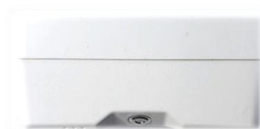
Bilde 2: Vertikalt montert, høyde 70 til 80cm