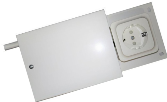
- Bryterenhet -